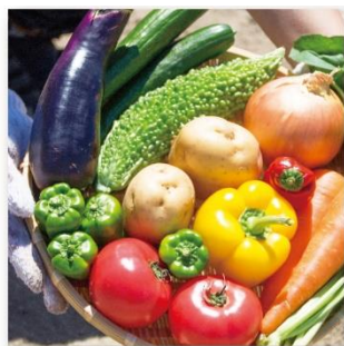
農産物販売の皆さん 大募集